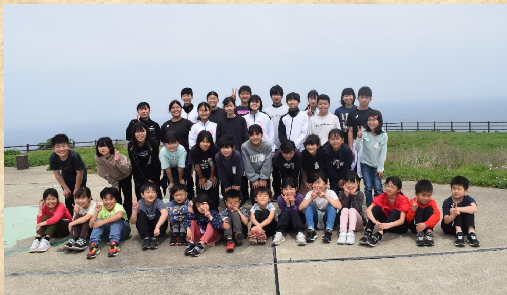
宗像市立義務教育学校 大島学園