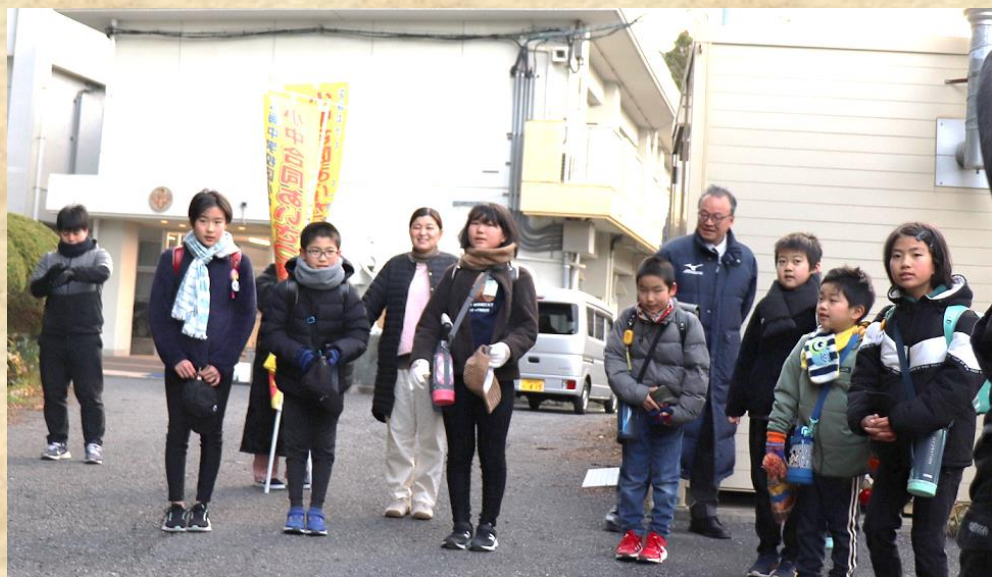
宗像市立 地島小学校

心から おみまい申し上げます 被災されたみなさまが 一日もはやく もとの生活にもどることを祈っています ずっとずっと おうえんしています