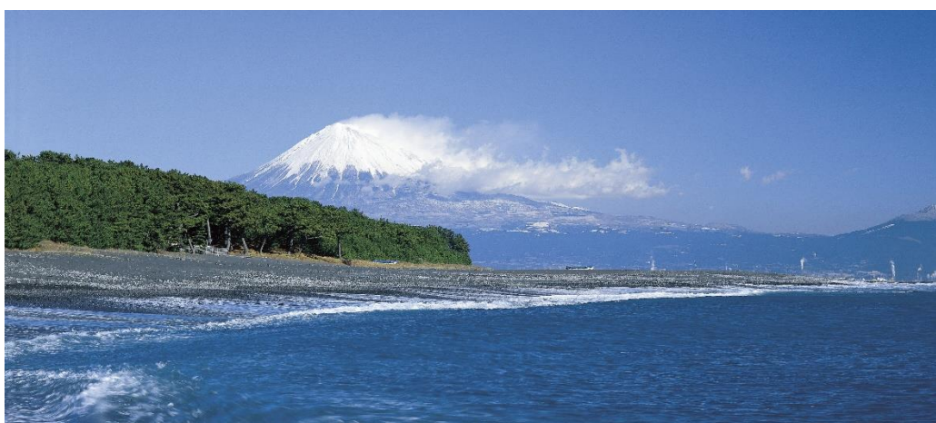
三保松原と富士山