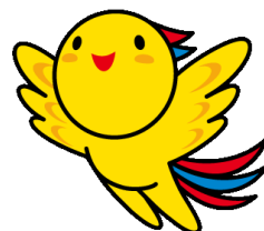
兵庫県マスコットはばタン