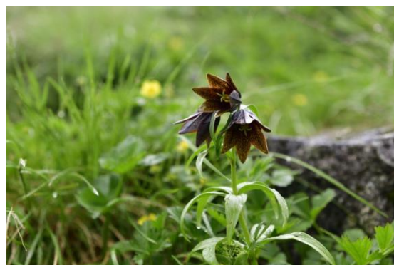
霊峰白山と県花クロユリ