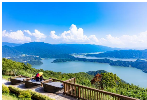
三方五湖レインボーライン 山頂公園

【主催】 全国へき地教育研究連盟東海北陸地区協議会 福井県へき地複式教育研究連盟