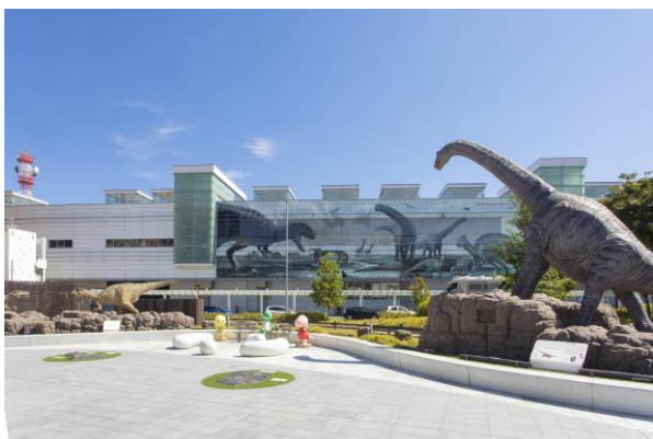
JR 福井駅 恐竜モニュメント

若狭町立梅の里小学校 三方上中郡若狭町田井 23-10-1 TEL:0770-46-1031